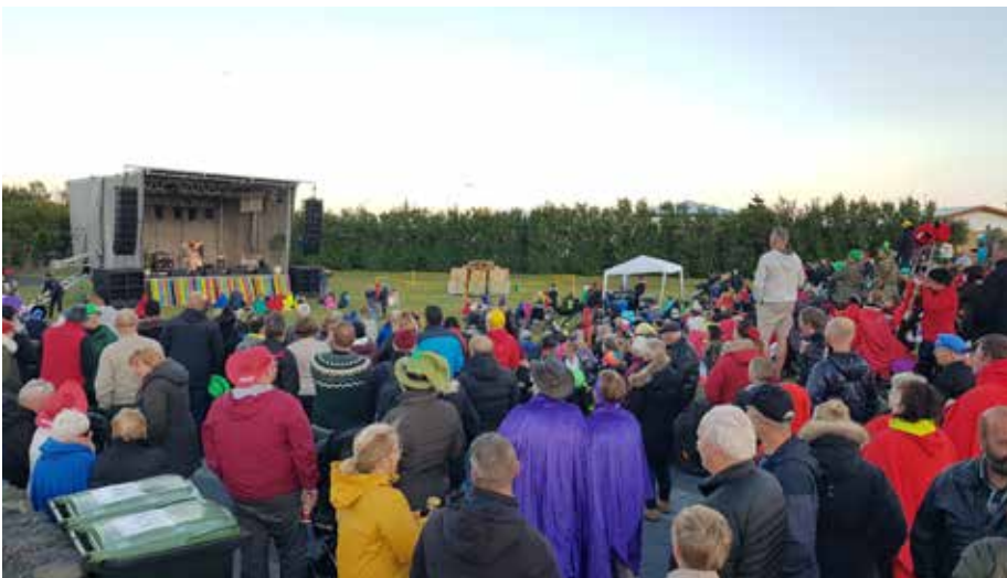
Útiskemmtun á Hafnardögum.

Meðal nýmæla í atvinnulífinu í sveitarfélaginu er að það hefur í samstarfi við Landsbankann og Þekkingarsetrið