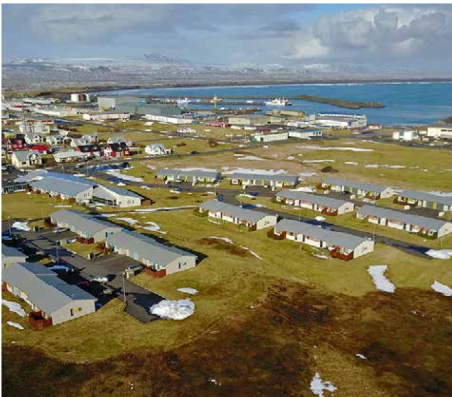
Ný hverfi hafa byggst upp í Þorlákshöfn undanfarin ár og fleiri eru í farvatninu.

„Ég held að almennt séum við sem samfélag komin út úr því að ræða erlenda ríkisborgar eins og einhvern sérstakan hóp. Þetta eru einfaldlega íbúar í okkar góða samfélagi sem heilt yfir hafa sömu þjónustupörf, langanir og væntingar eins og allir aðrir. Það er fátt annað en tungumálið sem greinir að. Við leggjum því mikið upp úr stuðningi við það sem tengist tungumálinu og svo fögnum við fjölbreytileikanum. Regnboginn er fallegri í mörgum litum. Það má vera að þessi staða sé mismunandi á milli sveitarfélaga og hér mótist þetta talsvert af því hversu