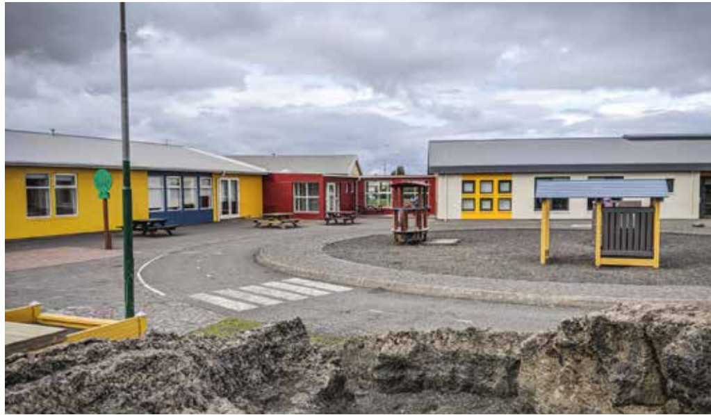
Leikskólinn Bergheimar í Þorlákshöfn.