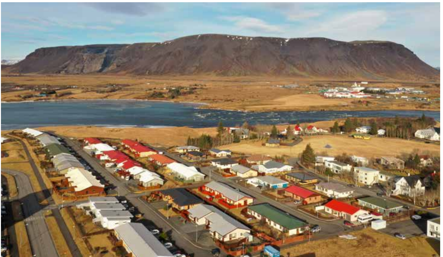
Selfoss horft yfir Ölfusá til Ingólfsfjalls.

Við erum öll reynslunni ríkari eftir þessa fordæmalausu tíma. Vonandi mun sú reynsla nýtast okkur til góðs þó svo að við viljum ekki upplifa viðlíka tíma aftur.