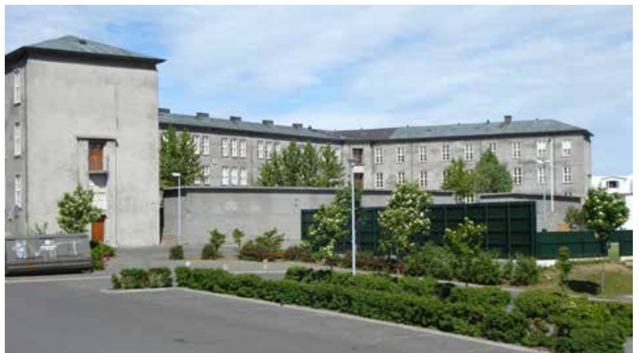
Austurbæjarskóli í Reykjavík.

Um þriðjungur grunnskólabarna landsins sótti skóla í Reykjavík, á bilinu 14.600 til 15.200 nemendur á árunum 1996–2005, grunnskólarnir voru frá 40 upp í 43 (sérskólum og einkareknum skólum fækkaði) og starfsmenn þeirra voru frá 2.100 upp í 2.400. Fræðslumálin urðu langstærsti málaflokkur borgarinnar og var um þriðjungi borgarsjóðs nú ráðstafað til þeirra. Stærð borgarinnar gaf möguleika á að taka skref sem gætu að ákveðnu marki gagnast öðrum sveitarfélögum.