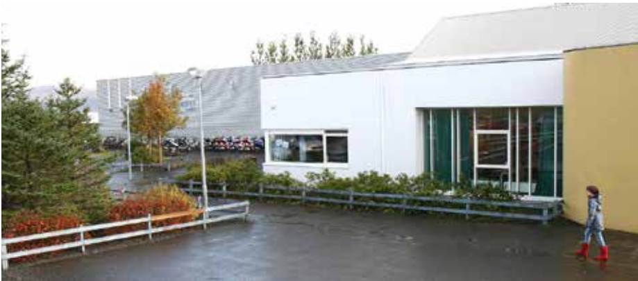
Engjaskóli í Reykjavík

Nýr meirihluti í borgarstjórn og nýráðin yfirstjórn málaflokksins lögðu mikinn metnað í að standa vel undir hlutverki Reykjavíkur sem höfuðborgar við móttöku grunnskólans sem kom m.a. fram í stórauðnum fjárframlögum til skólanna en ekki síst í byggingafrákvæmdum. Hlutverk fræðsluráðs fólst í stefnumótun og eftirliti. Hlutverk Fræðslumiðstöðvar Reykjavíkur, aðalskrifstofu grunnskólakerfisins í borginni, var annars vegar að framfylgja stefnu fræðsluráðs og menntamálaráðuneytis og safna gögnum vegna eftirlits ráðsins og hins vegar að sinna fjármálastjórnun og margvíslegri þjónustu við grunnskólana.