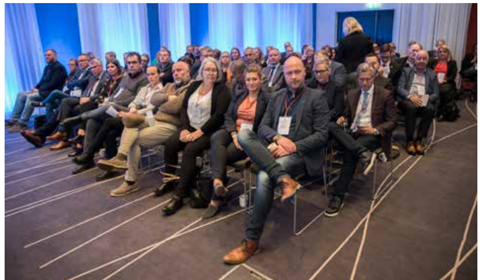
Myndirnar með greininni eru teknar á fjármálaráðstefnu sveitarfélaga 2019.

Fólk sem getur valið hvað það gerir í frítíma sínum kærir sig kannski ekki til lengdar um að sitja undir þeirri miklu og oft óvægnu gagnrýni sem það verður fyrir á samfélagsmiðlum. Fólk gefur kost á sér til starfa í sveitarstjórn til að láta gott af sér leiða og vill upplifa árangur af störfum sínum en verður oft og tíðum fyrir harkalegri og kannski oft ósanngjarnri gagnrýni. Fram kemur í nýlegri könnun sem sambandið stóð að meðal annarra að ríflega helmingur sveitarstjórnarfólks hefur upplifað mikið álag í starfi til lengri tíma. Þá verður í mörgum tilvikum eitthvað undan að láta.