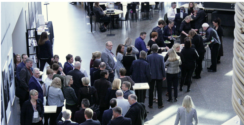
Landsþing sambandsins, hið fyrsta eftir sveitarstjórnarkosningar, var venju samkvæmt haldið á Akureyri.

Í apríllok efndi sambandið til morgunverðarfundar undir yfirskriftinni Viðkvæm álitamál og nemendur . Fjallað var um erfiðleika og áskoranir sem komið geta upp í skólastarfi þegar viðkvæm álitamál ber á góma, s.s. hryðjuverk, sjálfsvíg, andlát nákomins, einelti og skilnaðir.