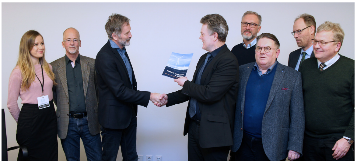
Leiðbeiningarrit Landverndar um „VirkJun vindorku á Íslandi“ kom út í lok febrúar og afhentu fulltrúar samtakanna stjórn sambandsins og starfsmönnum ritið til kynningar.