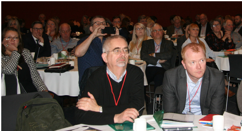
Fjármálaráðstefnan 2018 var fjölsótt að vanda.

Að ráðstefnunni aflokinni var þátttakendum sent rafrænt ráðstefnumat sem venja er. Röskur helmingur skilaði ráðstefnumati og voru niðurstöður jákvæðar. 36% svarenda kváðust mjög ánægðir með ráðstefnuna og 57% ánægðir. Þá er almenn ánægja með að bjóða upp á fjórar málstofur seinni daginn og rösklega 70% voru ýmist mjög ánægðir eða ánægðir með það fyrirkomulag.