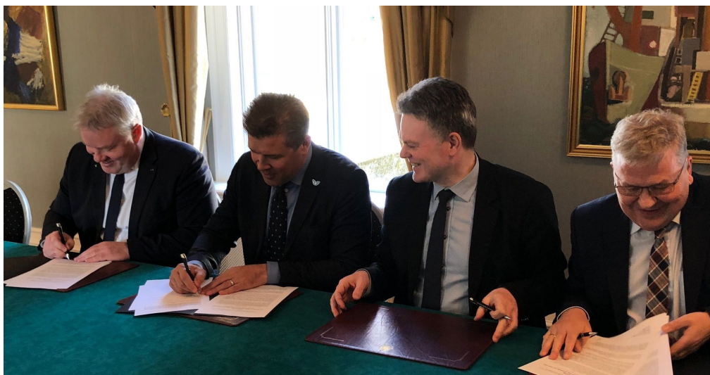
Samkomulag í Ráðherrabústaðnum í apríl 2018

Samningar landshlutasamtaka og Vegagerðarinnar um framkvæmd almenningsamgangna, sem gerðir voru á árinu 2012 runnu út í árslok. Ein landshlutasamtök skiluðu verkefninu en aðrir samningar voru framlengdir um eitt ár á meðan unnið