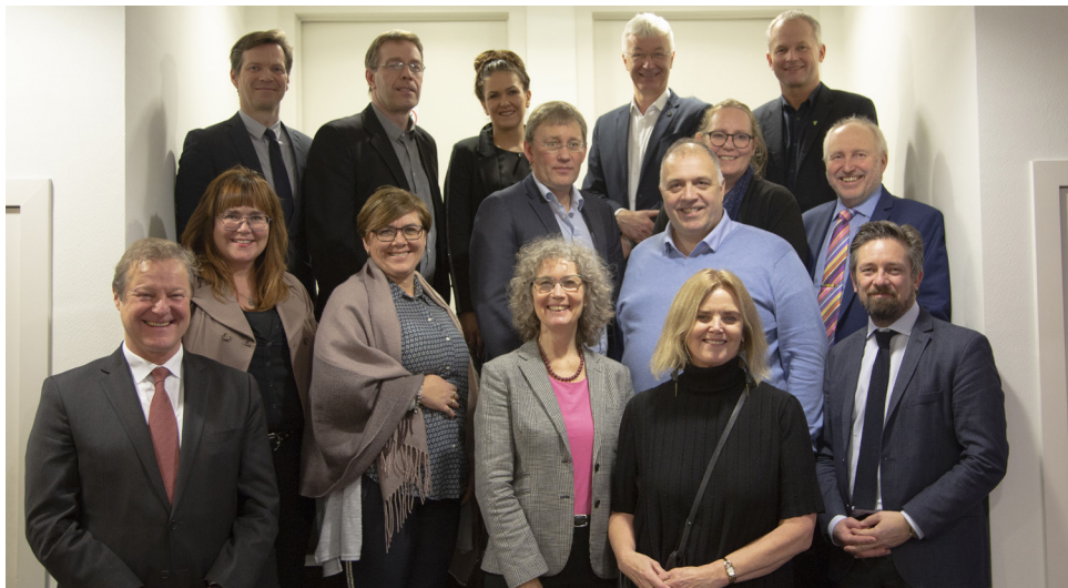
Fulltrúar á 18. fundi Sveitarstjórnarvettvangs EFTA sem fram fór í Brussel dagana 6.-7. desember 2108.

Fulltrúar Reykjavíkurborgar tóku ásamt sviðsstjóra þróunar- og alþjóðasviðs þátt í fundi í Búlgaríu um samstarfsverkefni með stuðningi EES uppbyggingarsjóðsins, sem fram fór í október.