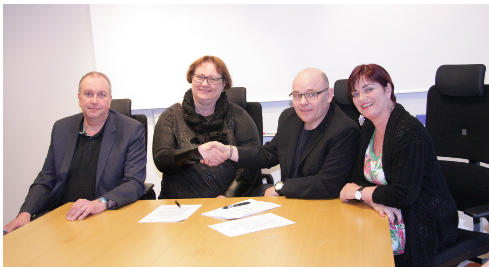
Kjarasamningur við Félag grunnskólakennara var undirritaður í maí 2108. Hér handsala fulltrúar sambandsins og Félags grunnskólakennara samninginn.

Kjarasvið sambandsins annast kjarasamningagerð fyrir hönd stjórnar sambandsins og hefur svarað fyrir í kjaramálum