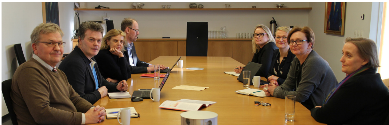
Þjóðminjavörður fundaði með sambandinu í mars.

Rammasamningur Sjúkratrygginga Íslands (Sí) um þjónustu hjúkrunarheimila rann út í árslok 2018 án framlengingar. Í fjárlögum 2019 er gert ráð fyrir hækkingu upp á 3,7% á málefna sviði 25 (hjúkrunar- og endurhæfingarþjónustu) sem fyrst og fremst má rekja til fjölgunar hjúkrunarrýma. Á móti er gerð aðhaldskrafa upp á 0,5%. Ljóst var að fulltrúar Samtaka fyrirtækja í velferðarþjónustu (SFV) og sambandsins í samninganefnd gátu ekki fellt sig við lakari