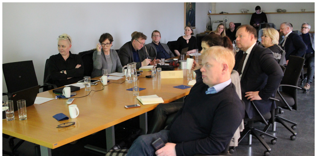
Vestfirðingar nýttu sér aðstöðuna í Borgartúni í febrúar til að funda með þingmönnum Norðvesturkjördæmis.

Önnur sameiginleg verkefni aðila eru umbætur í opinberri starfsemi. Um er að ræða áframhaldandi þróun á miðlægu þjónustugáttinni www.island.is þar sem stefnt er að því að landsmenn geti á einum stað nálgast þjónustu hins opinbera og sinnt þeim erindum sem beinast að stjórnvöldum. Unnið verður að því að opinberir aðilar sameinist um að birta í sameiginlegu rafrænu pósthólfi á www.island.is skjöl, sem