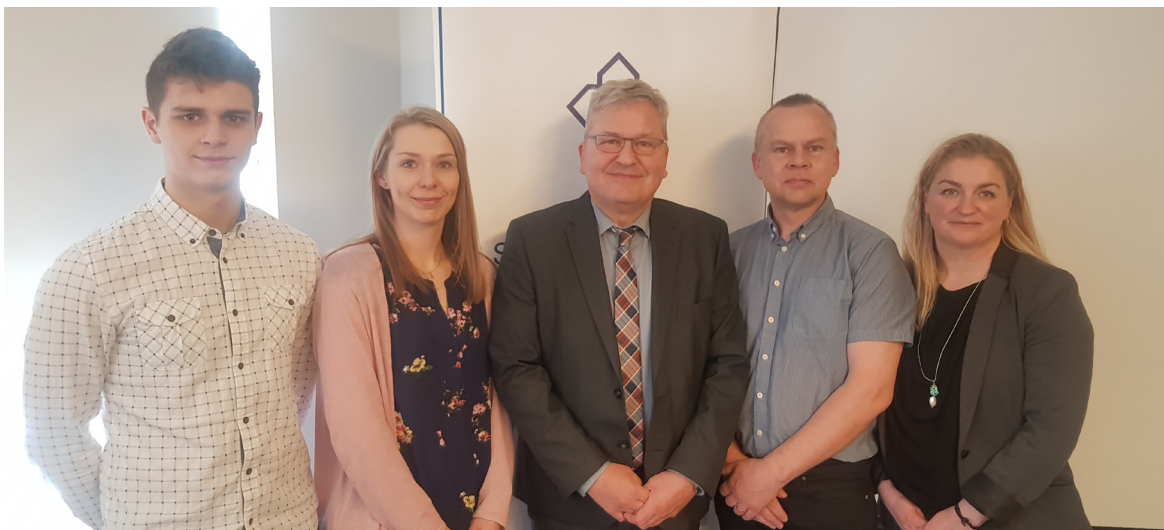
Samkomulag í Ráðherrabústaðnum í apríl 2018

Námskeið fyrir nýjar fræðslunefndir var haldið þann 26. nóvember á Grand hóteli. Að þessu sinni var eingöngu haldið eitt miðlægt námskeið á höfuðborgarsvæðinu sem gert var aðgengilegt öllu landinu með streymi. Námskeiðið var tekið