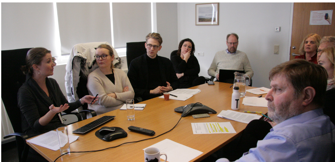
Fundur um heimsmarkmið Sameinuðu þjóðanna var haldinn í húsnæði sambandsins á vordögum 2018.

Sambandið hefur undanfarin sex ár verið að þróa rafræna upplýsingamiðlun í formi Tíðinda af vettvangi Sambands íslenskra sveitarfélaga, sem birt er á heimasíðu